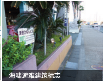
海啸避难建筑标志