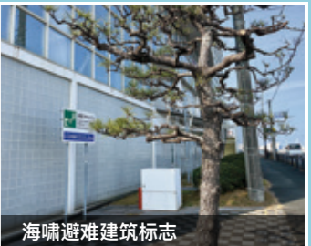
海啸避难建筑标志