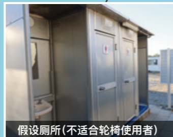
假设厕所(不适合轮椅使用者)