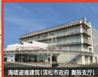
海啸避难建筑(滨松市政府 舞阪支庁)