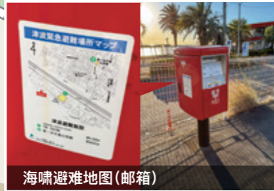
海啸避难地图(邮箱)